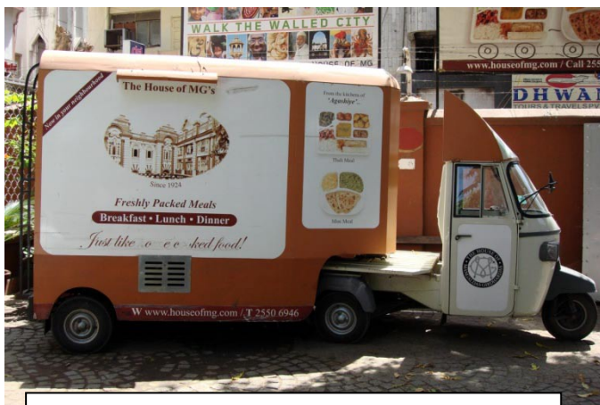
Agashiyes take-away vogne.

placeret på strategiske steder rundt om i byen kan købe et komplet og billigt delikatess-måltid som take-away. Det er således ikke svært at forstå, at de fleste af vores informanter foretrak indisk fastfood.