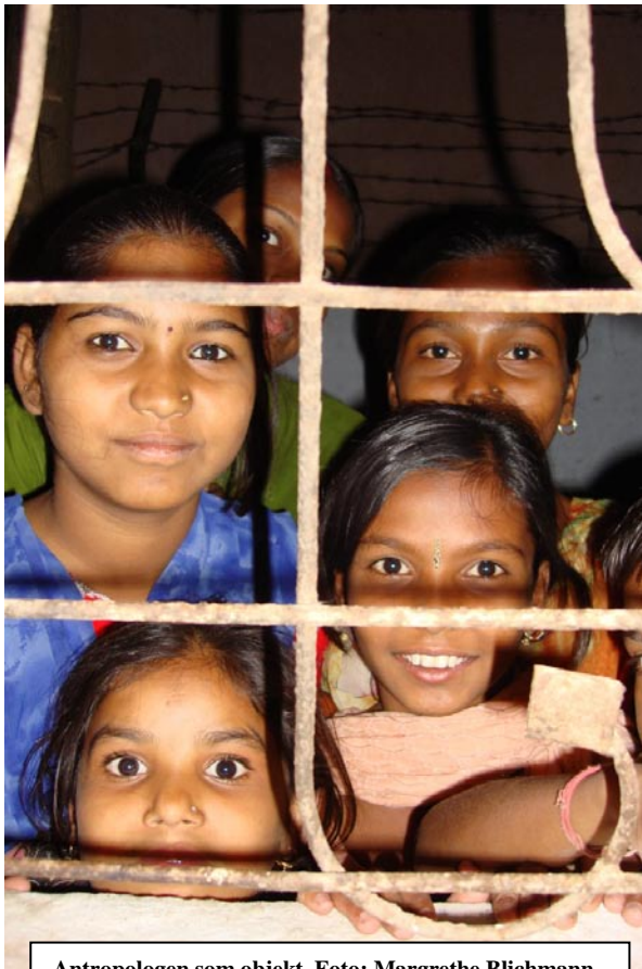
Antropologen som objekt.

vi os lidt udstillede, idet naboer og familiemedlemmer var blevet inviteret, eller havde inviteret sig selv, til at komme og kigge på de fremmede med det anderledes udseende, der så ud som nogen, de kun havde set på film. Det var som om, at det var os, og ikke de andre, der var objekter for et studie. Vi blev på denne måde tvunget til at håndtere refleksivitet på to måder; selvet som subjekt, i form af vores egenskab som studerende, og selvet som objekt, i form af den interesse vi blev vist, samtidig med at vi skulle forholde os til "den anden" både som objekt for vores observation og som observerende subjekt (Karim i Palriwala 2005: 157). Vi havde i en sådan situation svært ved at bryde igennem den mur af opmærksomhed, der var rettet